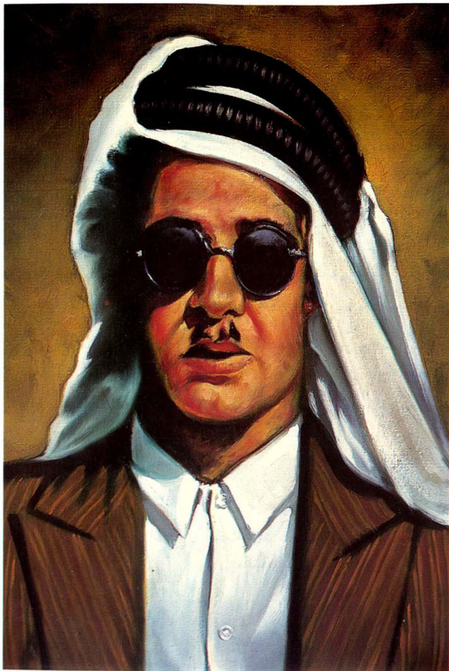
صورة الغلاف كما رسمها الفنان: عبداللطيف غلامي